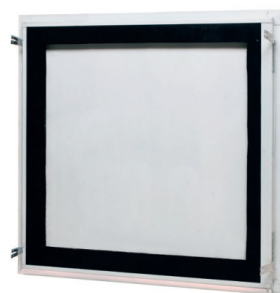
testata fino alla 600 x 600 mm

NUOVO: Adesso disponibile anche "A TENUTA D'ARIA E POLVERE"